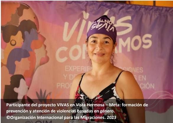
Participante del proyecto VIVAS en Vista Hermosa – Meta: formación de prevención y atención de violencias basadas en género.

promoviendo su autonomía socioeconómica y la prevención de la violencia basada en género (VBG). Fue así como se apoyó a la ARN en la consolidación y firma de la política de Reincorporación ante el Espacio Nacional de Consulta Previa con la población NARP.