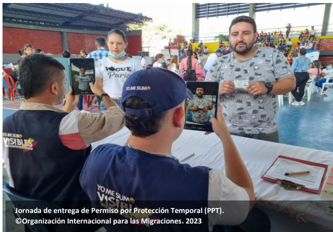
Jornada de entrega de Permiso por Protección Temporal (PPT).

OIM apoyó al Gobierno Colombiano en la integración socioeconómica de refugiados, migrantes y retornados colombianos a través de estrategias de empleabilidad y emprendimiento , beneficiando a 12.501 personas: 3.997 migrantes venezolanos, 8.400 de comunidades de acogida y 104 colombianos retornados . El 35% participó en la estrategia de emprendimiento y el 65% en la de empleabilidad.