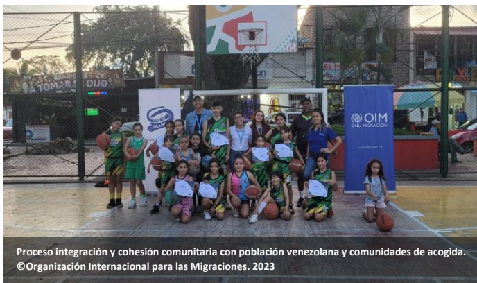
Proceso Integración y cohesión comunitaria con población venezolana y comunidades de acogida.

En términos de mejoras en la integración comunitaria , y con el respaldo del Ministerio de Relaciones Exteriores de Francia, y la Oficina de Población, Refugiados y Migración (PRM) del Departamento de Estado de los Estados Unidos de América, la OIM implementó proyectos orientados a apoyar la integración y mejorar las condiciones educativas de NNA refugiados y migrantes, retornados y sus comunidades de acogida en 30 escuelas de 13 ciudades, beneficiando a 5.543 estudiantes, de los cuales 3.460 eran migrantes