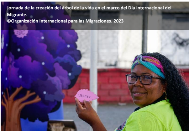
Jornada de la creación del árbol de la vida en el marco del Día Internacional del Migrante.

adolescentes, jóvenes y miembros de la comunidad en 85 instituciones educativas de 23 municipios; la campaña #TuvidaCambia, que hizo lo propio con más de 30.000 personas sensibilizadas para la identificación y referenciación de posibles víctimas de TdP; la estrategia #ModoSeguro 13 , con difusión nacional, alcanzando a más de 2.3 millones de personas; la sensibilización sobre los riesgos asociados a la TdP y el tráfico de migrantes (TiM) alcanzando a 17.743 personas; y la difusión en redes sociales mediante la publicación de videos informativos para la prevención de TdP.