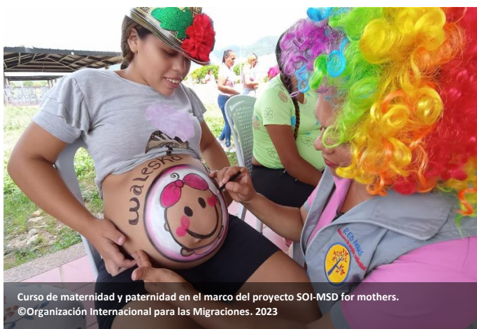
Curso de maternidad y paternidad en el marco del proyecto SOI-MSD for mothers.

Con el apoyo de la Oficina de Población, Refugiados y Migración de Estados Unidos (PRM por sus siglas en inglés) y a través de alianzas estratégicas con hospitales locales, la OIM brindó servicios de atención primaria en salud a 53.177 personas, cubriendo áreas como crecimiento y desarrollo, vacunación, medicina general, nutrición, odontología, higiene oral, control prenatal y posparto, asesoría para la interrupción voluntaria del embarazo, consejería en anticoncepción, ginecología y obstetricia, atención integral a pacientes con VIH, pediatría y medicina interna. Además, la OIM ofreció servicios de salud mental, incluyendo psicología, psiquiatría y acompañamientos psicosociales. Estas iniciativas mejoraron significativamente la salud integral de refugiados y migrantes, proporcionando acceso crucial a cuidados médicos y apoyo en salud mental.