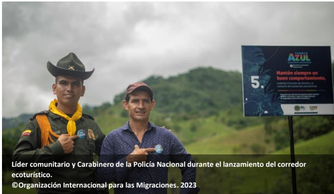
Líder comunitario y Carabiniere de la Policía Nacional durante el lanzamiento del corredor ecoturístico.

violencias comunitarias en contextos rurales afectados por el conflicto armado. Esta intervención se llevó a cabo en 16 micro territorios de siete municipios 26 , utilizando la Guía de Prevención de violencias rurales con enfoque comunitario . Esta guía proporciona a la Policía Nacional herramientas esenciales para implementar acciones preventivas de violencia.