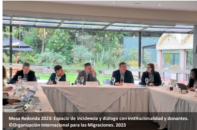
Mesa Redonda 2023: Espacio de incidencia y diálogo con institucionalidad y donantes.

El GIFMM coordinó la respuesta de sus socios con entidades del nivel nacional como Ministerio de Relaciones Exteriores, Departamento Nacional de Planeación, Migración Colombia, Agencia Presidencial de Cooperación Internacional de Colombia (APC) y el DANE. Lo anterior, con el fin de garantizar la complementariedad y aportes del RMRP 2023-2024 a las políticas públicas y apuestas del gobierno nacional y visibilizar las necesidades de refugiados y migrantes en Colombia.