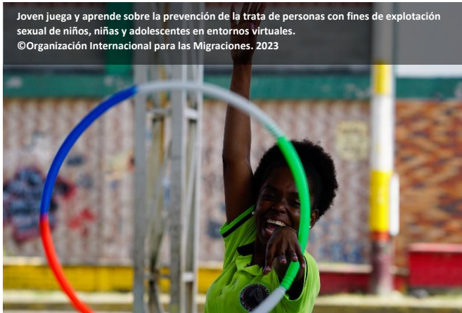
Joven juega y aprende sobre la prevención de la trata de personas con fines de explotación sexual de niños, niñas y adolescentes en entornos virtuales. ©Organización Internacional para las Migraciones. 2023

En respuesta a los flujos migratorios mixtos provenientes de Venezuela, la OIM apoyó al Gobierno de Colombia facilitando el acceso a servicios de protección, prevención y atención en casos de trata de personas, agua, saneamiento e higiene y educación. Esto benefició a 160.248 personas: 120.091 migrantes y refugiados venezolanos, 767 colombianos retornados y 39.390 miembros de comunidades de acogida.