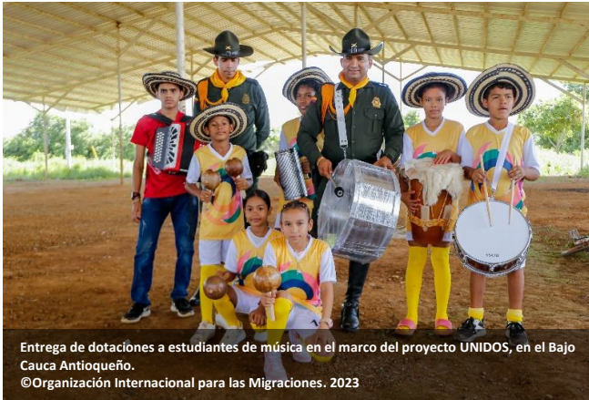
Entrega de dotaciones a estudiantes de música en el marco del proyecto UNIDOS, en el Bajo Cauca Antioqueño.

para 2021-2026. En los territorios PDET, estas iniciativas están alineadas con los PATR. El plan de acción fue co-construido con las comunidades y las instituciones locales, y el producto final fue socializado con la ARN, la comunidad, las instituciones locales y departamentales, y otros actores clave como la Misión de Verificación de la ONU.