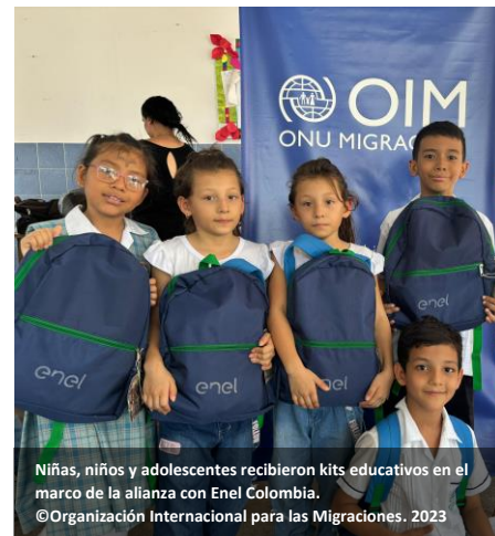
Niñas, niños y adolescentes recibieron kits educativos en el marco de la alianza con Enel Colombia.

Además, ENEL Colombia y OIM entregaron 1.750 kits escolares y tulas de segunda vida con el fin de aportar en el acceso a espacios educativos para NNA refugiados y migrantes, y de comunidades de acogida, así como la mitigación de brechas de exclusión y xenofobia en nueve instituciones educativas priorizadas de siete municipios.