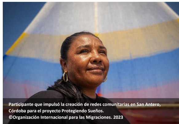
Participante que impulsó la creación de redes comunitarias en San Antero, Córdoba para el proyecto Protegiendo Sueños.

Finalmente, como parte de la estrategia de relacionamiento con el sector privado , la OIM fortaleció su alianza estratégica con la empresa Oleoducto Central S.A.S. (OCENSA) implementando la estrategia "Protegiendo Sueños", destinada a prevenir el reclutamiento, uso y utilización de niños, niñas, adolescentes y jóvenes (NNAJ) en los departamentos de Córdoba y Sucre. Esta estrategia mejoró las capacidades de los actores comunitarios para proteger integralmente a los NNAJ frente al reclutamiento,