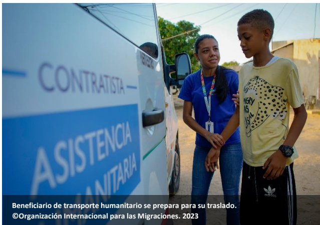
Beneficiario de transporte humanitario se prepara para su traslado.

En el marco del RMRP, durante 2023 el GIFMM logró avances significativos en varios sectores, entre los que se incluye: