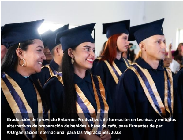
Graduación del proyecto Entornos Productivos de formación en técnicas y métodos alternativos de preparación de bebidas a base de café, para firmantes de paz.

Como parte de este acompañamiento, 26 personas en reincorporación que participan en los proyectos colectivos obtuvieron empleo directo, en roles como técnico productivo, auxiliar administrativo, administrador de granja, operarios, mayordomos, auxiliares de bodega, conductores, operadores de maquinaria amarilla, trilladores, tostadores, moledores, secretarías y auxiliares de ventas, bajo modalidades de obra labor y contrato por prestación de servicios.