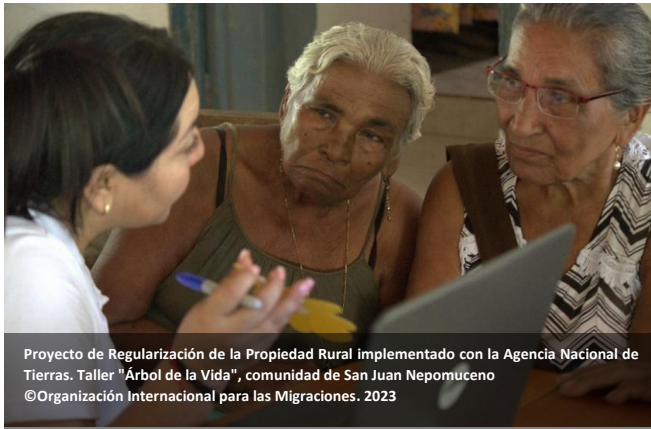
Proyecto de Regularización de la Propiedad Rural implementado con la Agencia Nacional de Tierras. Taller "Árbol de la Vida", comunidad de San Juan Nepomuceno

Durante 2023, la OIM apoyó a la Agencia Nacional de Tierras en su proceso de planeación territorial mediante la implementación de la política de Ordenamiento Social de la Propiedad Rural (OSPR). A través del acompañamiento en la regularización y formalización de predios rurales, la OIM contribuyó a mejorar la calidad de vida de los campesinos, brindándoles seguridad jurídica sobre la tierra, aumentando su patrimonio y reduciendo las barreras de acceso al crédito.