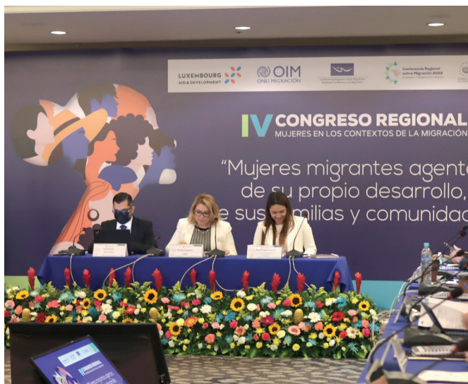
PARTICIPACIÓN EN EL CUARTO CONGRESO REGIONAL: MUJERES EN LOS CONTEXTOS DE LA MIGRACIÓN.