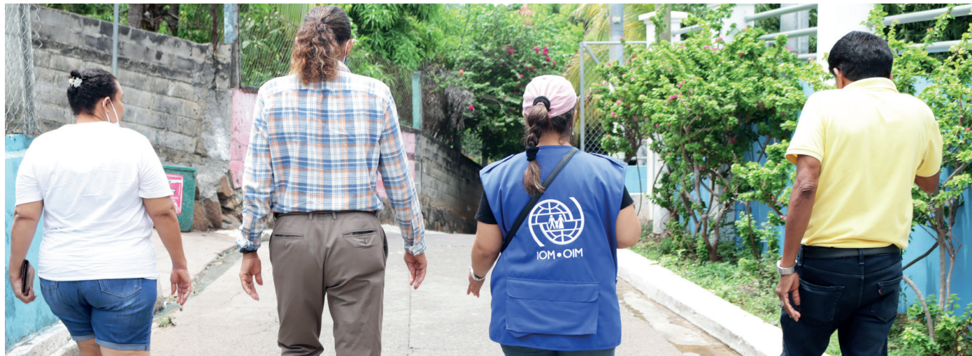
REUNIÓN CON LIDERESAS Y LÍDERES COMUNITARIOS EN MEANGUERA DEL GOLFO, LA UNIÓN, EL SALVADOR.

Como organización intergubernamental líder en el campo de la migración, la Organización Internacional para las Migraciones (OIM) promueve la migración segura, ordenada y regular al proporcionar servicios y asesoramiento a los gobiernos y migrantes desde una perspectiva integral y holística. Establecida en 1951, la OIM ha trabajado de cerca con las Naciones Unidas y otras partes interesadas claves desde su fundación, tanto a nivel operacional como a nivel de políticas públicas. En septiembre de 2016, la OIM se unió al SNU, convirtiéndose en la Agencia de las Naciones Unidas para la Migración, como un reconocimiento a sus acciones indispensables en el campo de la movilidad humana, lo que permitió su participación en el Grupo de Desarrollo Sostenible de las Naciones Unidas. La OIM cuenta ahora con más de 170 Estados Miembros, oficinas en más de 400 lugares sobre el terreno y más de 20.000 funcionarios, de los cuales el noventa por ciento trabaja en el terreno.