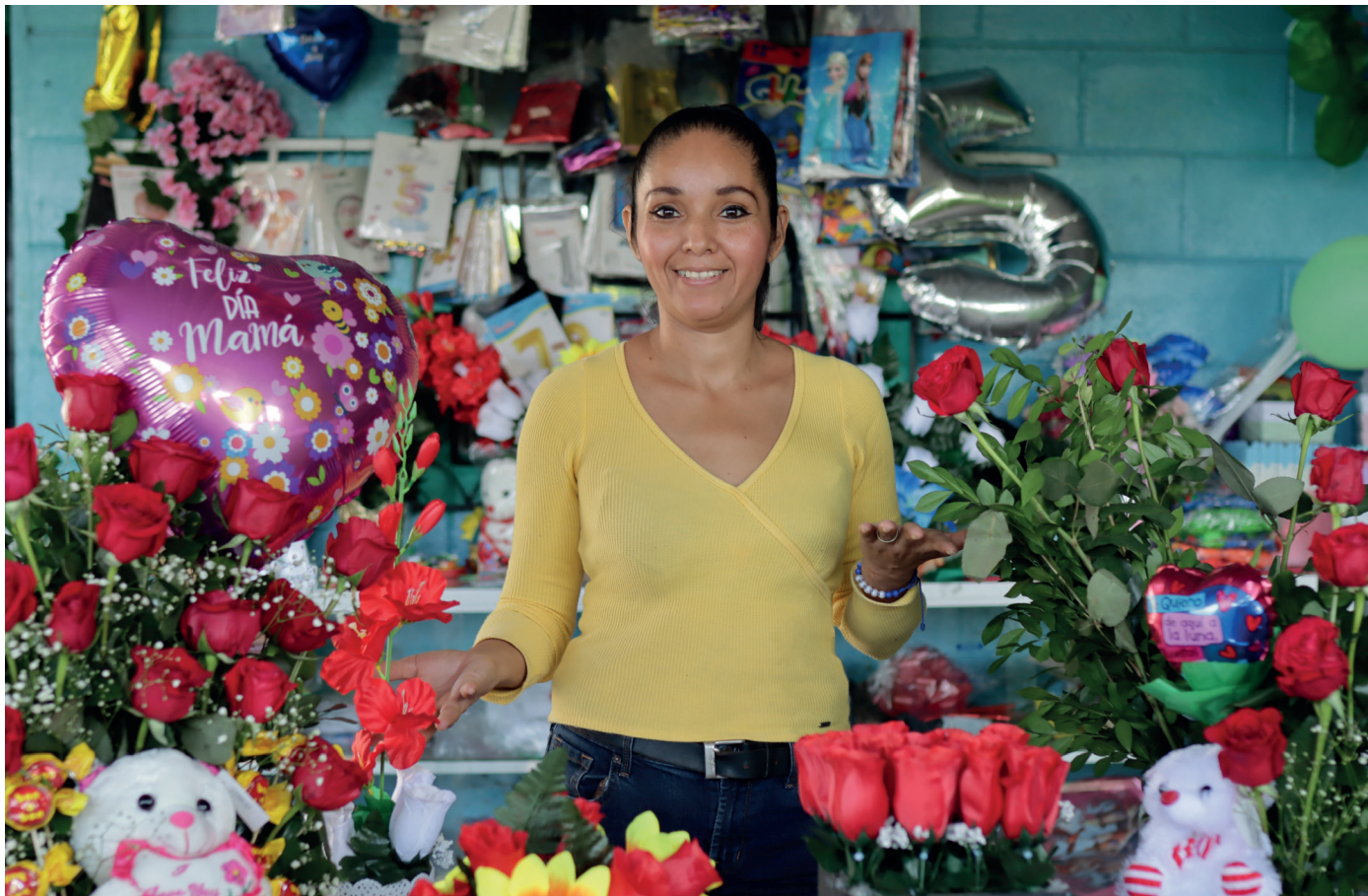
PARTICIPANTE DEL PROYECTO ENFOCADO EN FACILITAR LA REINTEGRACIÓN DE PERSONAS MIGRANTES RETORNADAS.