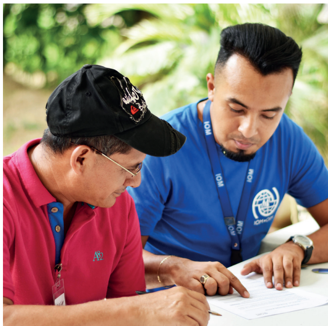
TALLERES DE ATENCIÓN PSICOSOCIAL PARA PERSONAS RETORNADAS PARTICIPANTES DE PROGRAMAS DE REINTEGRACIÓN ECONÓMICA.